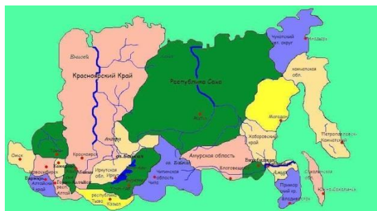
Рис.10,11. Сенатор Совета Федерации РФ А.Н.Чилингаров и Карта регионов присутствия ГК по развитию Сибири и Дальнего Востока РФ.