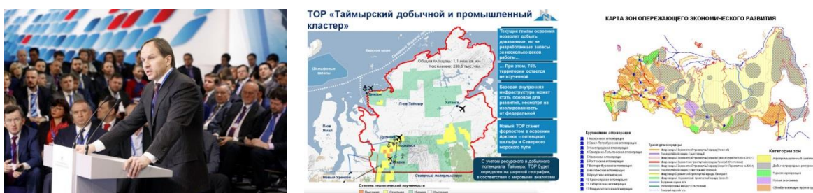
Рис. 4,5,6. Выступление губернатора Красноярского края Л.В.Кузнецова на КЭФ-2014; ТОР «Таймырский кластер»; Зоны опережающего экономического развития РФ.

В ответ на актуальные запросы текущего момента в марте 2014 г. более тридцати экспертов из шести городов РФ – предприниматели, политики и общественные деятели - подготовили ряд практических предложений по включению малого и среднего бизнеса в программы и планы создания северной инфраструктуры. Катализатором этих процессов стало заявление губернатора Красноярского края Л.В.Кузнецова на XI Красноярском экономическом Форуме (КЭФ-2014), где он сообщил о создании Арктического кластера, включающего в себя Норильский промышленный район и освоение шельфа Таймыра. Этот регион был объявлен территорией опережающего экономического развития (далее ТОР) наряду с другими муниципалитетами Дальнего Востока, Красноярского края и Республики Хакасия.