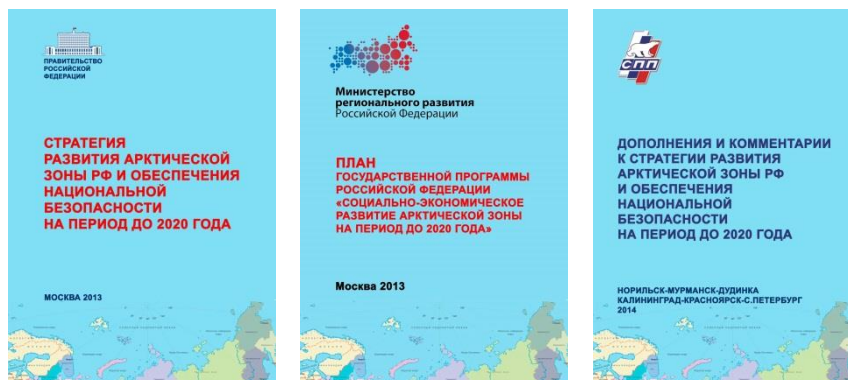
Рис. 1,2,3. Основные документы федерального уровня, регламентирующие развитие Арктической зоны РФ: Стратегия, Госпрограмма (в настоящее время «заморожена») и Дополнения в Стратегию ТОР «СПП» 2013 г.

береговой транспортной и промышленной инфраструктуры, научно-образовательного комплекса, среды обитания человека, внедрения инноваций и новых технологий, в т.ч. в области экологии и устойчивого развития.