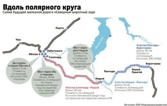
Рис.12,13. Проекты ГЧП в Заполярье: «Белкомур» и «Северный широтный ход»

Кроме того, не нужно исключать и трехстороннее сотрудничество «государство — бизнес — общество». В этом случае будет организован комплексный мониторинг развития Арктики как макрорегиона, обеспечивающий предупреждение будущих структурных беспорядков.